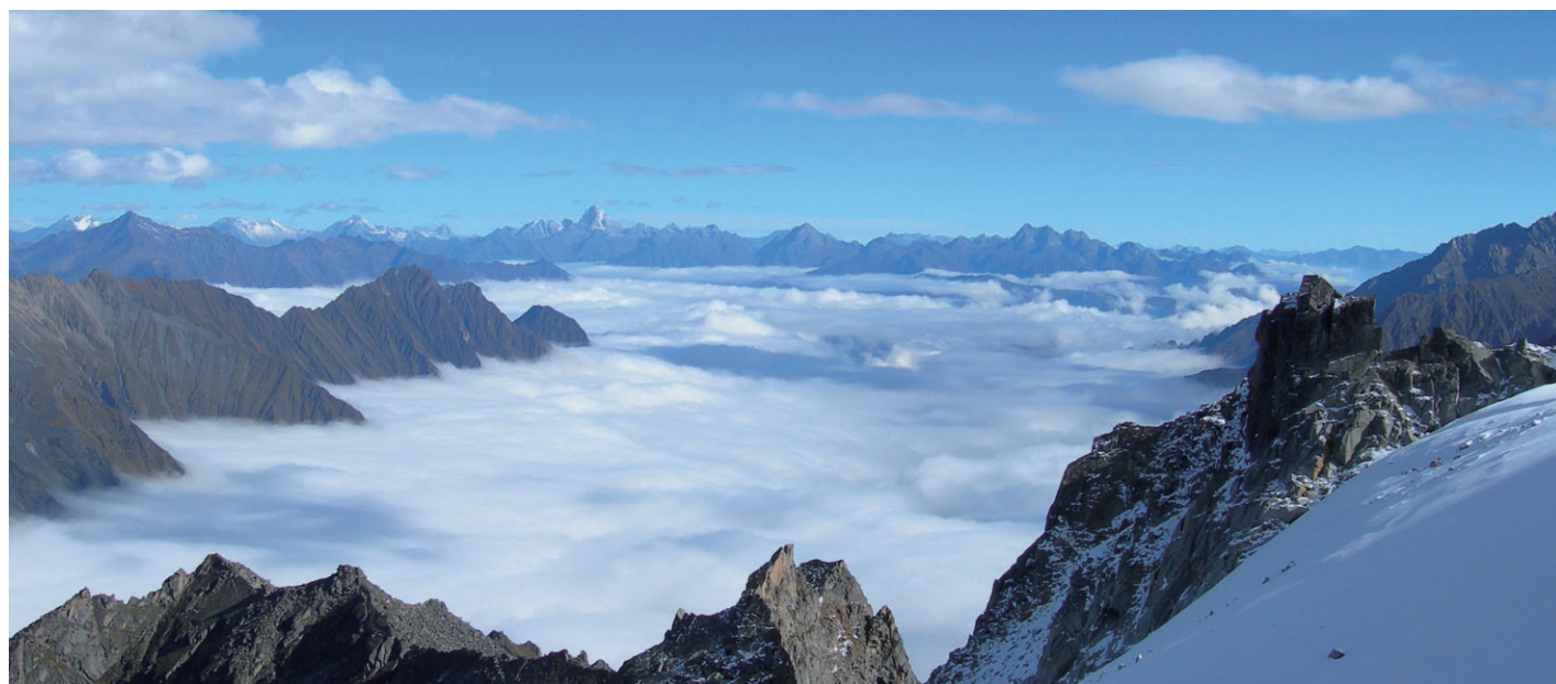
畢棚溝壯麗景點之一—「雪山雲海」